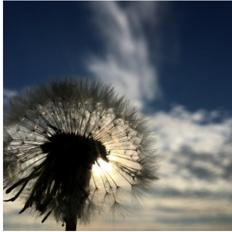
B. Gade © GemeindebriefDruckerei.de

08.06.2025 - Konfirmation um 14 Uhr in der Stiftskirche Petersberg